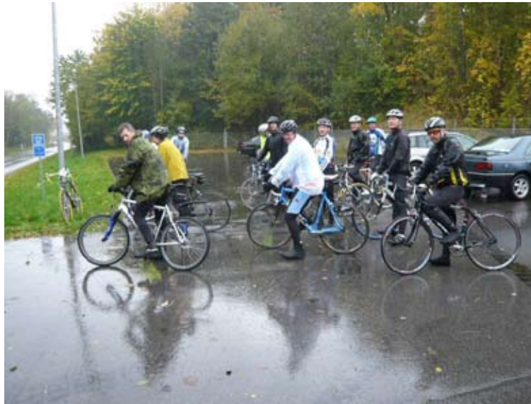
Mon ikke de fleste fornemmer det våde vejr med dette billede.

Fredag den 24. okt. afsluttede vi sæsonen med en lille "våd" cykeltur af DMI ruten 2009, efterfulgt af øl/vand og pølser i klubhuset ved sydmolen.