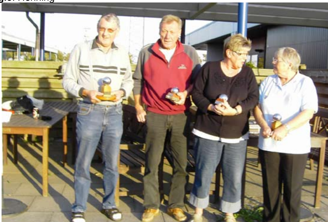
Vinderne af årets mesterskab.