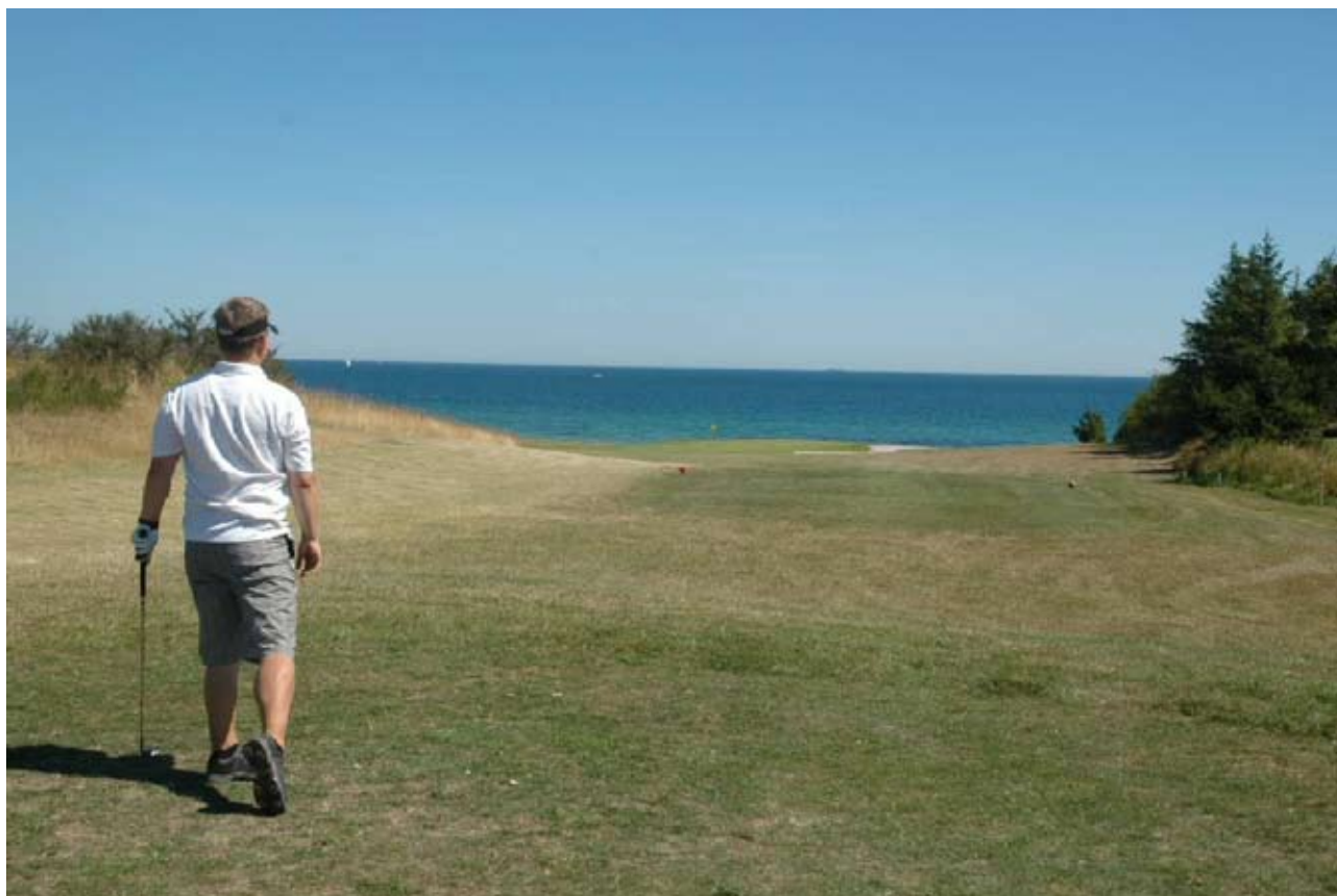
Banen ligger på Samsøs østlige side med en fantastisk udsigt over Storebælt.

Det er udvalgets ønske at komme rundt til alle regionens baner i løbet af en årrække. Da vi efterhånden har været godt rundt på fastlandet, besluttede vi os for at prøve med en tur til Samsø. Det lykkedes på en af årets fantastiske sommerdage. Efter en længere transport end vanligt og en god time på havet, ankom vi til banen.