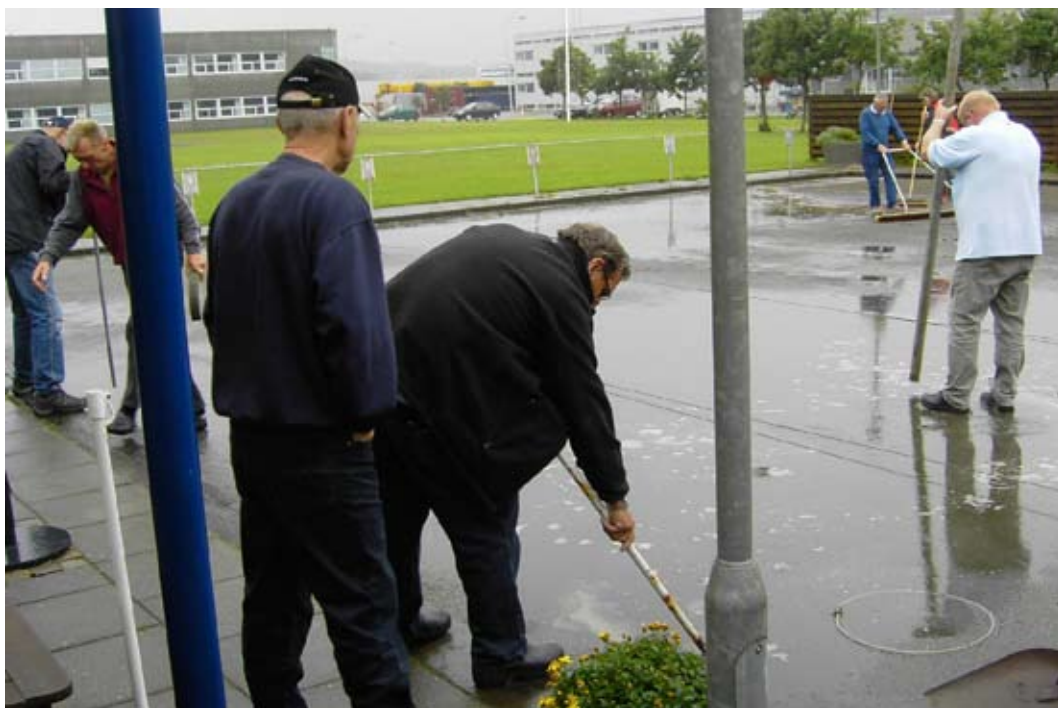
Vandet måtte ligefrem skovles væk før vi kunne spille.

Petanque har igen i år haft klubmesterskab, selv om det var med en del forhindringer. Dagen startede med silende regn og som det fremgår af billederne, måtte vi alle ha`fat i kost og skovl for at få vandet væk fra banerne. Det lykkedes også, så vi kunne gå i gang ved middagstid, dog med begrænsede baner, så kom ikke og sig` at petanque folk er pivede. Mestre blev: