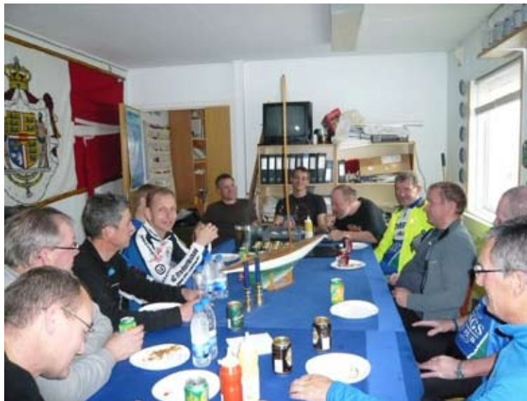
Det luner godt med en pølse ovenpå så våd en omgang

Jeg vil gerne rette en tak til alle for en skide god sæson og jeg håber vi ses til generalforsamlingen engang medio februar 2009; jeg skal lige i den anledning minde om, at kontingentet skal være betalt i god tid inden generalforsamlingen.