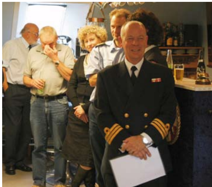
Kent benyttede lejligheden til at tale lidt til de fremmødte

Formand for Søværnets Idrætsforeningers Fællesudvalg