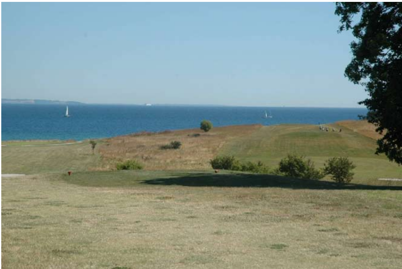
Banen er meget kuperet og der var derfor heldigvis nogle "lette" huller ned af bakke.