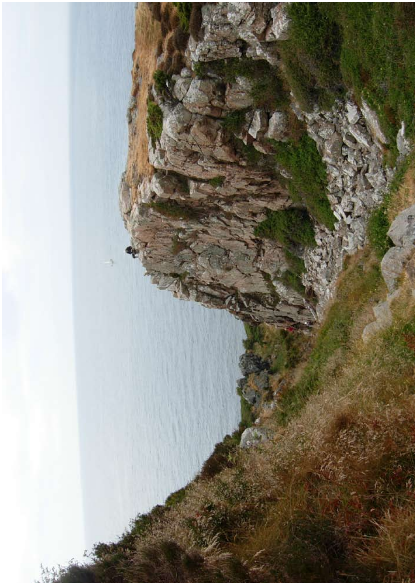
Der er langt ned fra toppen - og til bunden.....