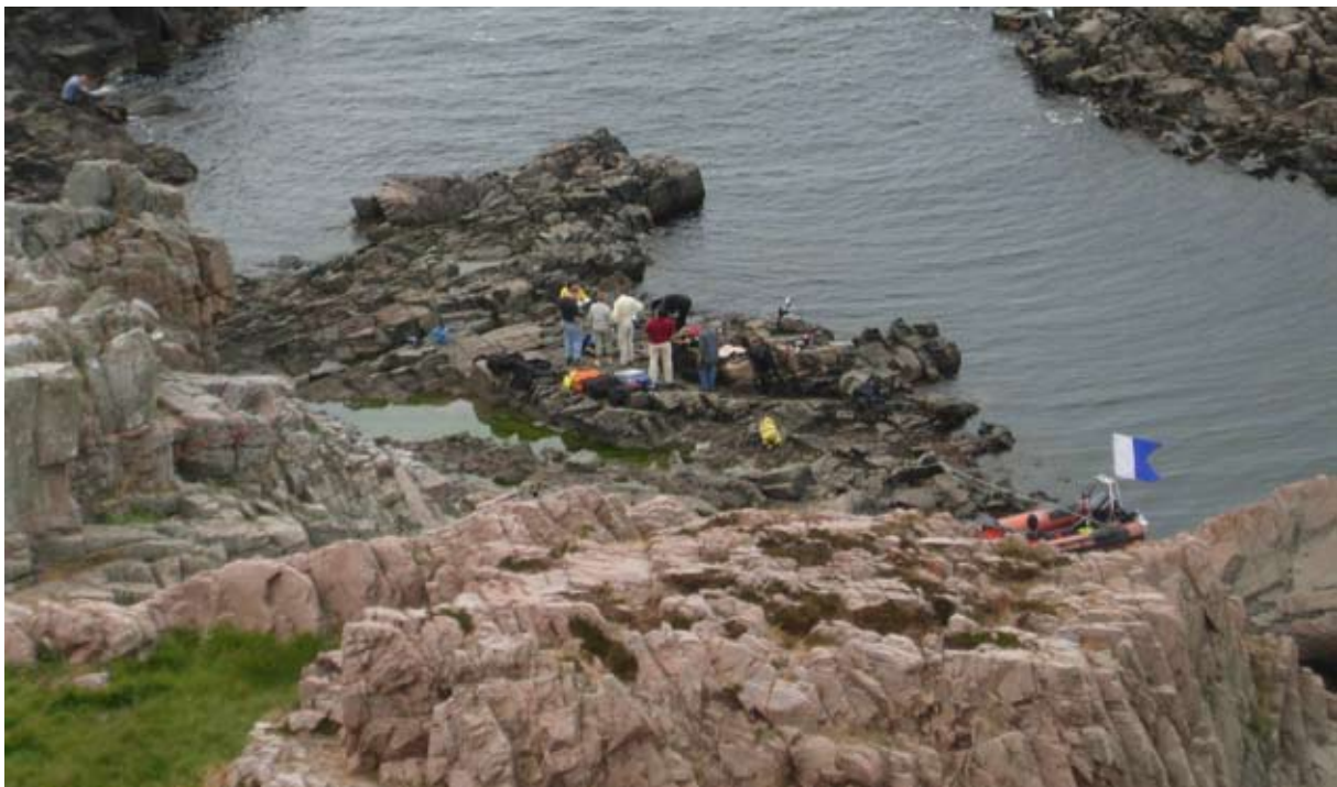
Fra udflugten til Kullen